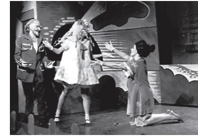
Los cuernos de don Friolera