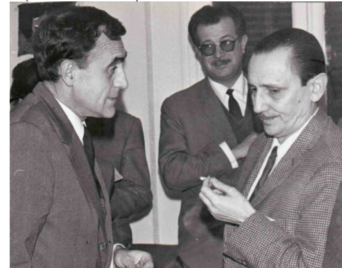
Pepe con Buero Vallejo

Necesidad de transformación del teatro español. Maestro. Talleres teatrales. RESAD.