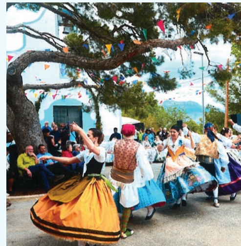
Festes de Sant Vicent del Captivador