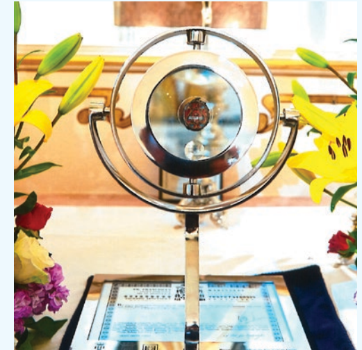
Reliquia de Sant Vicent