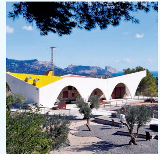
Centro de Estudios Medioambientales