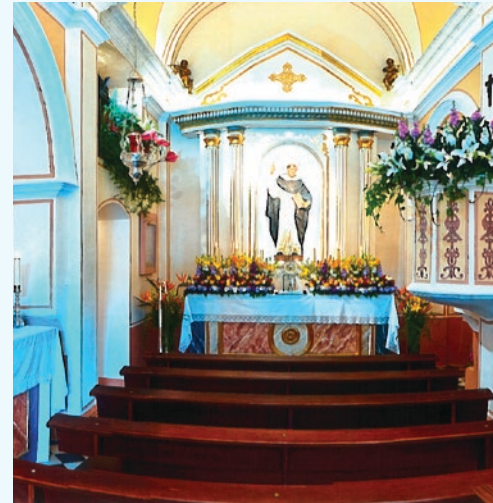
Interior de la Ermita

Una visita al Captivador y a la ermita del pare Sant Vicent Ferrer no deja indiferente a nadie.